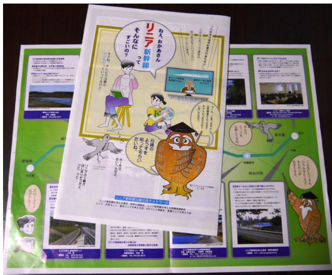
タブロイド版 4 頁：大きさ 273(右綴じ)x406mm