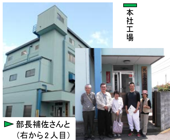
▶ 部長補佐さんと（右から2人目）

地下水を使い、おいしく品質にこだわったお豆腐など「自然との共生を目指した食づくり」をされている共生食品さんを、5月20日緑区橋本台の本社工場にお訪ねしました。社長さんはお留守でしたが、まだお若い現場の製造部、部長補佐さん（社長の息子さん）と衛生管理課長さんにお話しを聞きました。