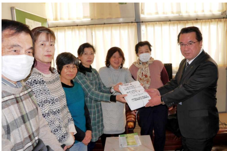
学校長(右端)へ署名を届けた住民たち(1月21日)

JR東海の工事は、生徒が在学している間は認めないでください。 工事は移転してから行うようJR東海に要求してください。